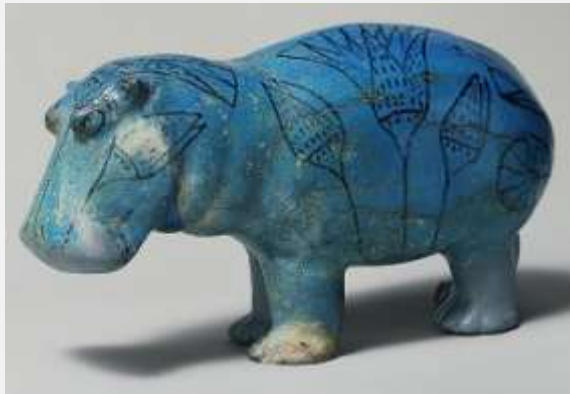
Μέσο Βασίλειο, Δωδέκατη Δυναστεία, π. 1981-1885 π.Χ.

71. Οἱ δὲ ἵπποι οἱ ποτάμιοι νομῶ μὲν τῷ Παπρημίτῃ ἱροὶ εἰσι, τοῖσι δὲ ἄλλοισι Αἰγυπτίοισι οὐκ ἱροὶ. φύσιν δὲ παρέχονται ἰδέης τοιήνδε· τετράπουν ἐστί, δίχηλον, ὅπλαι βοός, σιμόν, λοφιὴν ἔχον ἵππου, χαυλιόδοντας φαῖνον, οὐρὴν ἵππου καὶ φωνήν, μέγαθος ὅσον τε βοῦς ὁ μέγιστος· τὸ δέρμα δ' αὐτοῦ οὕτω δὴ τι παχύ ἐστί ὥστε αὐοῦ γενομένου ξυστὰ ποιέεσθαι [ἄκόντια] ἐξ αὐτοῦ.