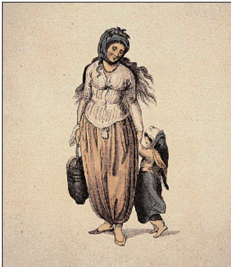
Τοπική ενδυμασία της Μαρμαρονήσου σε επιχρωματισμένη χαλκογραφία των αρχών του 19ου αιώνα.