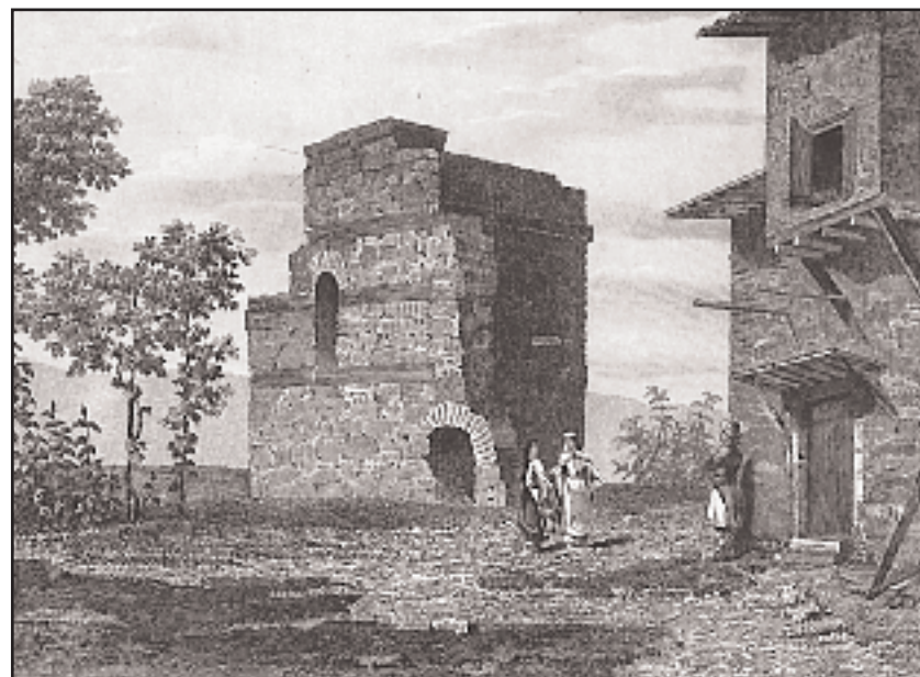
Το εξαφανισμένο σήμερα βυζαντινό ερείπιο, γνωστό ως «παλάτιον του Ιουστινιανού» που έδωσε και την προσωνυμία στο χωριό Παλάτια. Γκραβούρα του 1862 από τον τόμο Asie Mineure του Charles Texier.