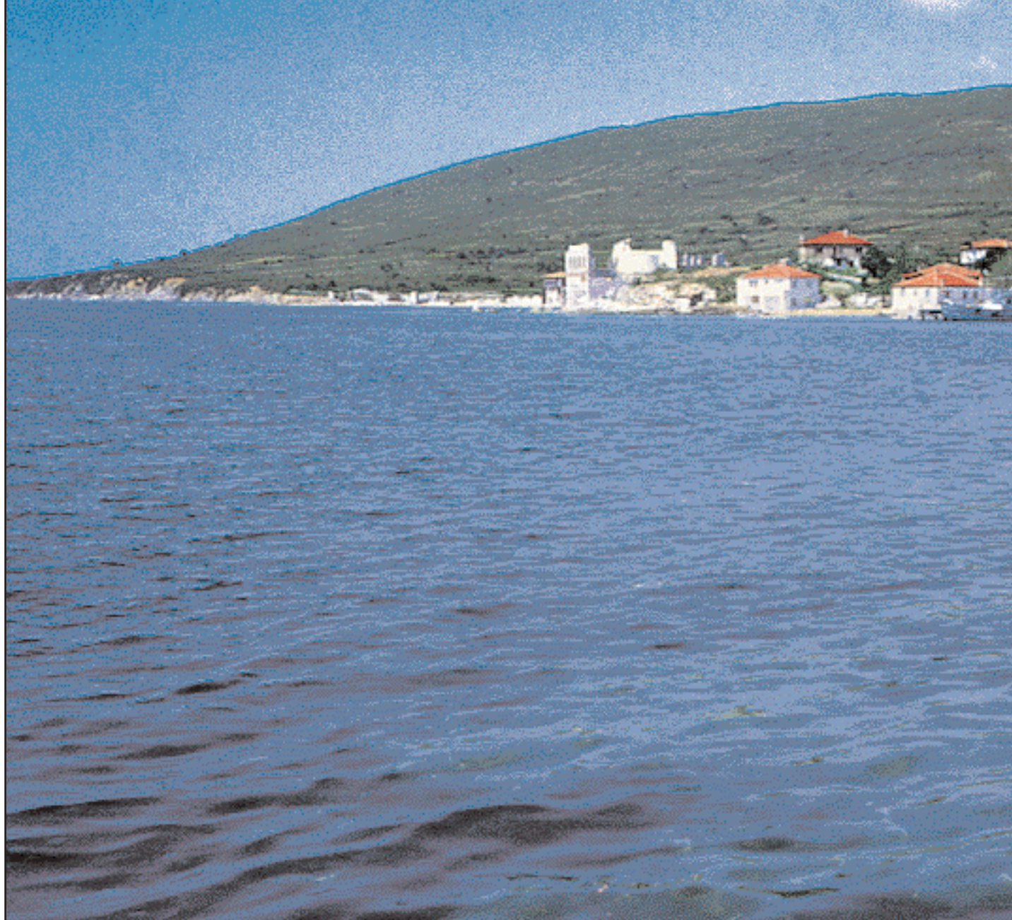
Γενική άποψη της Κούταλης, με το βουνό του Προφήτου Ηλιού και τα ερείπια του ναού της Κοιμήσεως της Θεοτόκου, κατά το 1970.

Ολες σχεδόν οι εκκλησίες της Μαρμαρονήσου, εγκαταλελειμμένες μετά την έξοδο, ρήμαξαν στον μεγάλο σεισμό του 1935. Των περισσότερων σήμερα έχουν εξαφανιστεί και τα χαλάσματα. Τότε κατέπεσε και το «παλάτι του Ιουστιανού» οικόδομη μνημειακή που έδωσε την ονομασία του στο πέμπτο χωριό, «πόλιν», κατά τον Στράβωνα «έχουσα και μέταλλον μέγα, λευκού λίθου, σφόδρα επαινούμενον». Εδώ, στα Παλάτια, ο ταξιδιώτης που θα περιηγηθεί τα αρχαία εγκαταλελειμμένα νταμάρια –κι ένα προχειροφτιαγμένο υπαίθριο δήθεν μουσείο– θα συναντήσει και τον Άγιο Νικόλαο, τη μικρή εκκλησία της Γέννας, που με τοιχοδομημένα τα παράθυρα και την είσοδο, αποτελεί ίσως το μόνο όρθιο χριστιανικό κτίσμα της άλλοτε ευδαίμονος μητροπόλεως Προικονήσου.