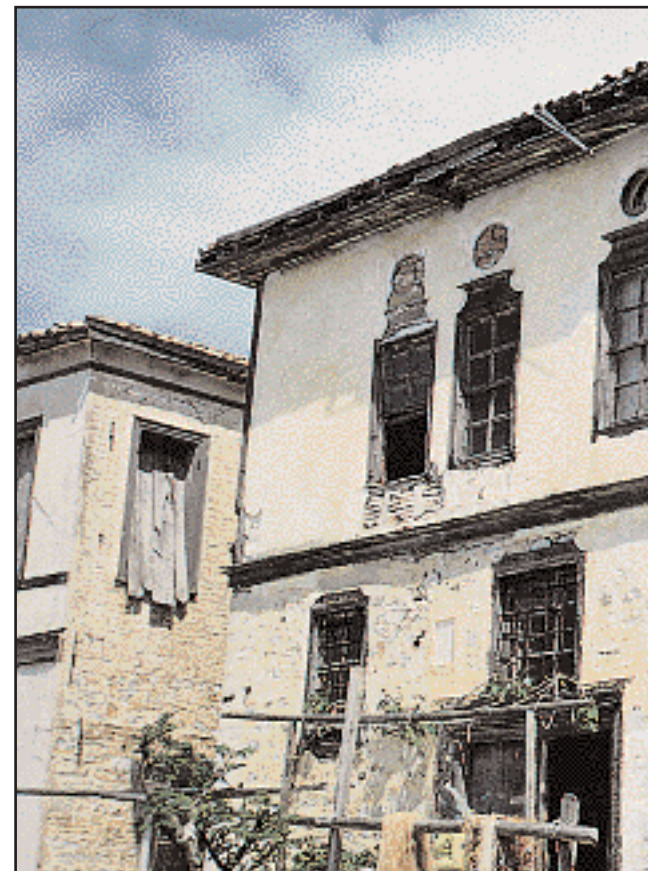
Από τα ελάχιστα αρχοντικά που περισώθηκαν στην Κούταλη, το 1827. (Φωτ. 1970).