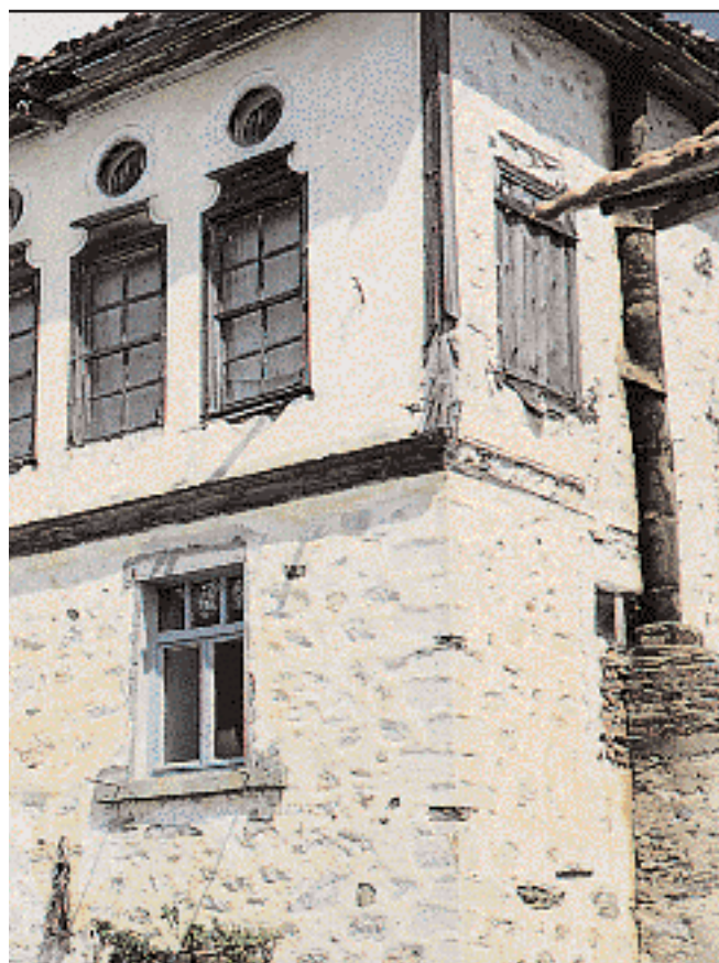
το κονάκι του καπετάν Ιωάννη Παντελή, κτισμένο κατά τον Ιού-