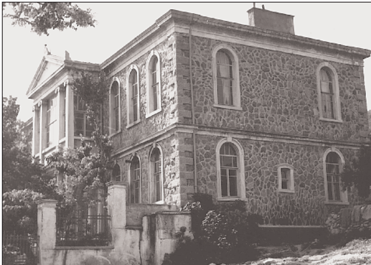
Η Ελληνική Σχολή του Πραστειού, στο ομώνυμο χωριό της Μαρμαροννήσου.

Κατά τα τέλη όμως του περασμένου αιώνα παραπονείται ο Μανουήλ Γεδεών ότι «η προσέγγις εις Ραιδεστόν, Γάνον, Χώραν, Μυριόφυτον,