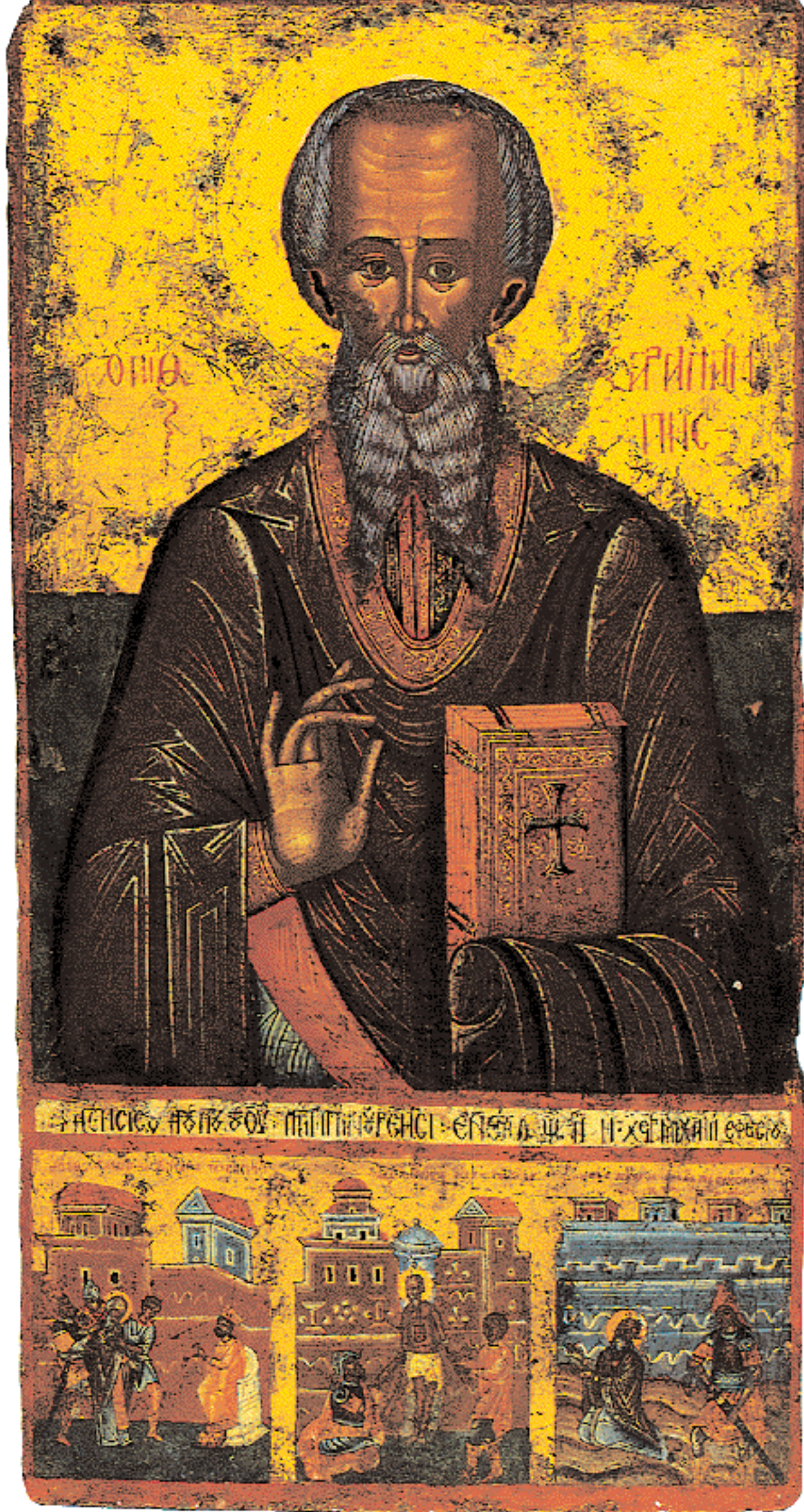
Αγιος Χαράλαμπος, εικόνα του 1738 από την Κούταλη «δέσεις του δούλου Θεού Λαμπρινού Ρέσι», ιστορημένη διά χειρός Μιχαήλ Εφεσίου. Προσφυγικό κειμήλιο (Βυζαντινό Μουσείο Αθηνών).