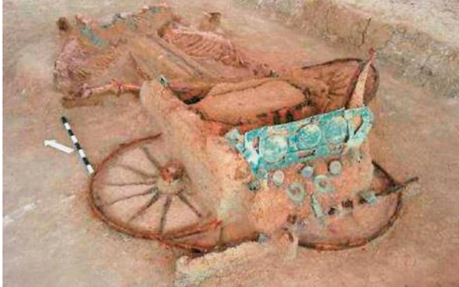
Η άμαξα Β΄ που βρίσκεται κοντά στο κέντρο του τύμβου και η διακόσμηση στην πίσω όψη της ίδιας άμαξας.

»Οι πέντε άμαξες έχουν εναποτεθεί μαζί με τα υποζύγιά τους σε ρηχούς λάκκους. Σε όλες διατηρούνται οι σιδερένιοι άξονες, τα σιδερένια στεφάνια (επίσωτρα) και τα σιδερένια περιαζόνια των τροχών, καθώς και τα υπόλοιπα χάλκινα και σιδερένια λειτουργικά και διακοσμητικά εξαρτήματα. Οι άμαξες χωρίζονται σε δύο ομάδες. Στην πρώτη ομάδα, που βρίσκεται στο δυτικό τμήμα, αλλά κοντά στο κέντρο του τύμβου, ανήκουν οι άμαξες Β΄ και Γ΄ και η ταφή αλόγων Α΄ .