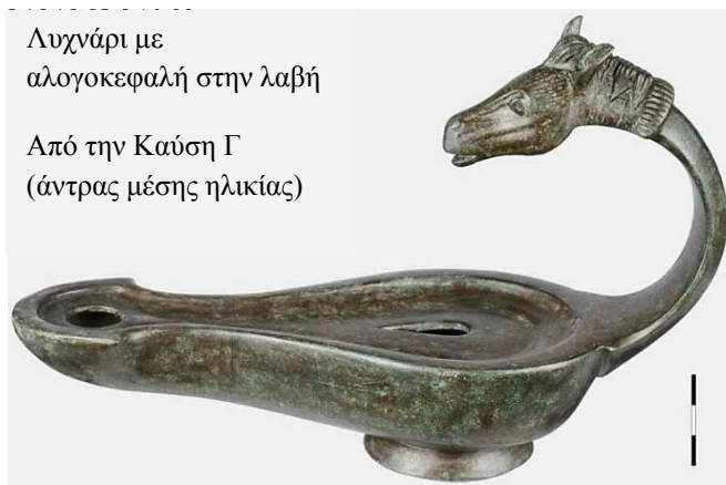
Λυχνάρι με αλογοκεφαλή στην λαβή

Αν όλα αυτά καταφέρουν να αλλάξουν την σημερινή εικόνα της ερημίας που δίνει ο συνοριακός αυτός τόπος κι αν τον τοποθετήσει κανείς στο πλαίσιο της συνεχώς αναπτυσσόμενης Θράκης της Αυτοκρατορικής περιόδου, θα μπορέσει να εξηγήσει και την ύπαρξη του πλούσιου Τύμβου της Μικρής Δοξιπάρας - Ζώνης. Ο Τύμβος, που χρονολογείται στις αρχές του 2ου μ.Χ. αι., δηλαδή στα χρόνια του Τραϊανού, καλύπτει τις ταφές, σωστότερα τις καύσεις, τεσσάρων μελών μιας οικογένειας Θρακών γαιοκτημόνων. Πρόκειται για οικογενειακό μνήμα που κατασκευάστηκε γύρω στο 100-105 μ.Χ., προφανώς για ένα μέλος της οικογένειας και, στην διάρκεια της επόμενης δεκαετίας, δέχτηκε άλλα τρία μέλη, τα οποία αποτεφρώθηκαν και ενταφιάστηκαν εδώ (Καύση Α, Β, Γ και Δ). Οι νεκροί ήταν τρεις άντρες και μία γυναίκα. Οι δύο άντρες ήταν μέσης ηλικίας κι ο τρίτος ήταν ένας νέος άντρας. Νέα ήταν και η γυναίκα. Η αιτία του θανάτου των νέων ανθρώπων δεν γνωρίζουμε αν έχει γίνει γνωστή. Οι αρχαιολόγοι, μάλιστα, με την βοήθεια των μελών της διεπιστημονικής επιτροπής, κατέληξαν στο συμπέρασμα ότι η τέταρτη και τελευταία καύση που έγινε σε αυτόν τον ταφικό χώρο ήταν η σορός της νεαρής γυναίκας. Στην συνέχεια το μνήμα «έκλεισε» κι όλος αυτός ο χώρος, ο οποίος είχε ήδη σκεπαστεί με έναν τύμβο εντυπωσιακών διαστάσεων, δεν ξανάνοιξε έως το 2002, όταν άρχισε η ανασκαφή.