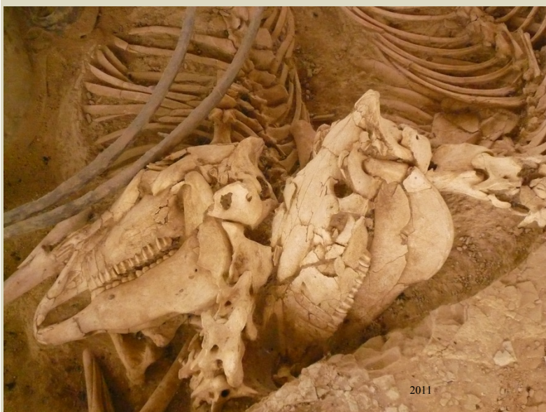
Μικρή Δοξίπαρα - Ζώνη

Το άλογο, ένα ζώο δυνατό και περήφανο, αποτέλεσε, από τη στιγμή που εξημερώθηκε, σταθερό σύντροφο του ανθρώπου στον πόλεμο, στις μετακινήσεις, στις αγροτικές εργασίες, στο κυνήγι και στα ιππικά αγωνίσματα. Τα φυσικά χαρίσματα του αλόγου και η πρακτική βοήθεια που πρόσφερε στους ανθρώπους, του εξασφάλισαν μια σταθερή θέση στη μυθολογία, τη θρησκεία και την τέχνη του ελληνορωμαϊκού κόσμου. Οι Ρωμαίοι ειδικότερα ανέπτυξαν σε μεγάλο βαθμό την ιπποφορβία, επειδή είχαν να αντιμετωπίσουν αυξημένες ανάγκες στο στρατό και στις μετακινήσεις και επειδή αγαπούσαν ιδιαίτερα τα ιππικά αγωνίσματα. Ταφές αλόγων έχουν βρεθεί σε πολλές περιοχές του ελληνορωμαϊκού κόσμου. Η συνήθεια ταφής των αλόγων δίπλα στους ιδιοκτήτες τους, έχει διαπιστωθεί δύο ακόμη φορές σε ανασκαφές ταφικών τύμβων της Αυτοκρατορικής περιόδου στην περιοχή του βόρειου Έβρου.