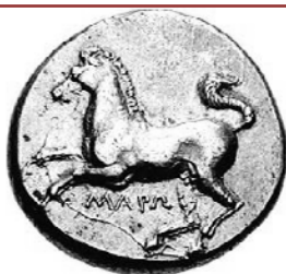
Άλογο που καλπάζει σε τετράδραχμο της αρχαίας Μαρόνιας, αιγαιική Θράκη (386-348 π.Χ)

Η Χερσόνησος του Αίμου (Βαλκανική) στα μέσα του 2ου μ.Χ. αι., λίγο μετά την κατασκευή του Τύμβου της Δοξιπάρας (που σημειώνεται εδώ με καφέ βούλα πάνω στον Άρδα), και μία ή δύο δεκαετίες αφότου ο αυτοκράτορας Αδριανός θεμελίωσε τη μεγαλύτερη πόλη της ιστορικής Θράκης, την Αδριανούπολη, στην συμβολή του Άρδα και του Τόντζου με τον Έβρο. Ο χάρτης είναι από την Ιστορία του Ελληνικού Έθνους τ. ΣΤ' (Εκδοτική Αθηνών) σ. 149. Δες και τμήμα του ίδιου χάρτη στην επόμενη σελίδα