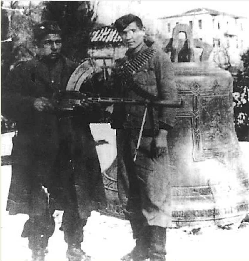
Κιλκίς. Αντάρτες του ΕΛΑΣ μπροστά στην καμπίνα.

Έπειτα ήρθαν τα χρόνια τα μεταπολεμικά: τα χρόνια της «ανοικοδόμησης». Το ξέφρενο χτίσιμο, και το παράλληλο γκρέμισμα των πάντων. Η αρχή ενός κόσμου νέου, που χτίστηκε πάνω στα συντρίμια του παλιού.