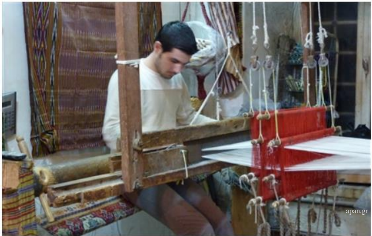
Ο νεαρός υφαντής ανήκει στην πέμπτη γενιά άξιων υφαντών της οικογένειάς του. Χαλέπι 2009