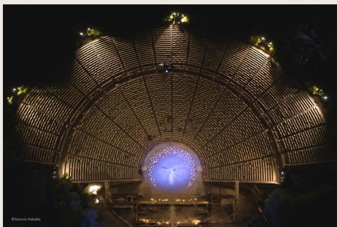
Φωτογραφίες από τη συναυλία στην Επίδαυρο τον Ιούλιο 2020 - GALLERY

Μια εμπνευσμένη πρωτοβουλία του Φεστιβάλ για να αρχίσει μαγικά η νέα χρονιά. Γιατί μόνο με τη μαγεία μπορούμε να αποδράσουμε.