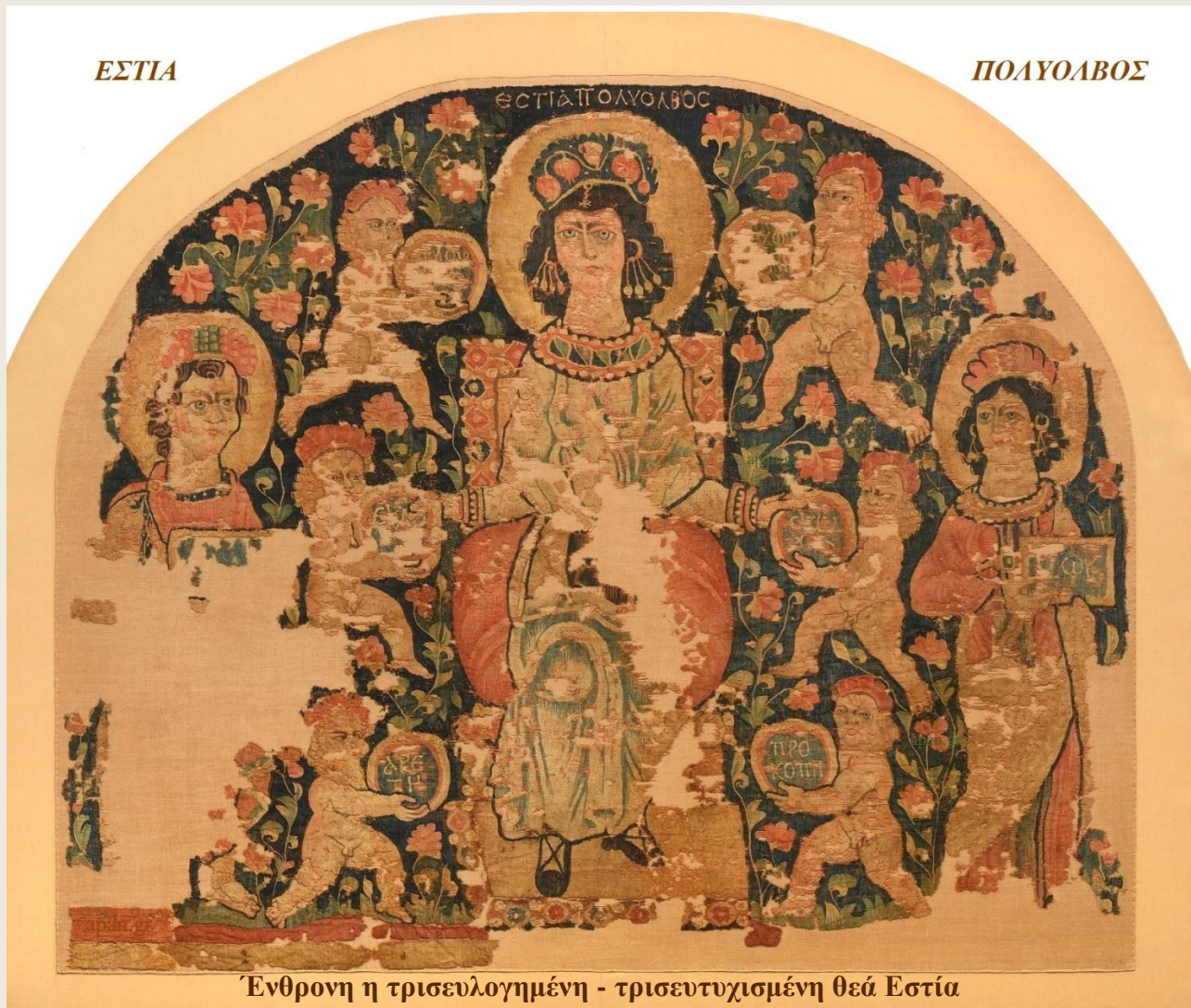
Ένθρονη η τρισευλογημένη - τρισευτυχημένη θεά Εστία