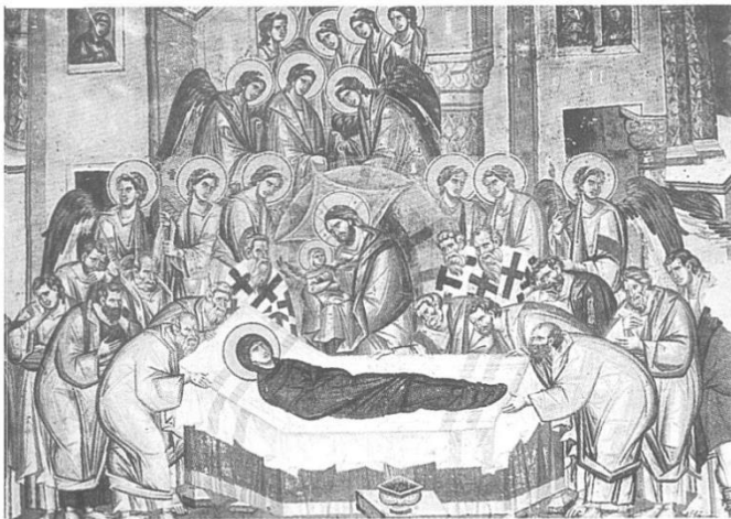
Παναγία Περιβλέπτου, λεπτομέρεια από την Κοίμηση της Θεοτόκου, στον δυτικό τοίχο του ναού. Υπέρλαμπρο έργο των Αστραπάδων, του 1295, τοποθετημένο στο αρχιτεκτονικό σκηνικό που χαρακτηρίζει την επιστροφή στα αρχαιοελληνικά πρότυπα της παλαιολόγιας τέχνης (κίονες, κιονίσκοι κ.λπ.). Τάγματα αγγέλων κατεβαίνουν μέσα από τα κτίσματα και «Απόστολοι εκ περάτων» σπεύδουν στην εντυπωσιακή νεκρική κλίνη με το λευκό σεντόνι. Η κεκοιμημένη Θεοτόκος είναι τυλιγμένη στο σκούρο μαβί μαφόρι. Ο χρυσοκεντημένος Χριστός κρατά την ψυχή της. Φωτ. Αρχαιολογικό Μουσείο Αχρίδας, Όχριντ 1990

βυζαντινής Αχρίδας. Άλλοι αποδίδουν την οικοδόμησή της στον τσάρο Σαμουήλ κι άλλοι στον πολέμαρχο Βουλγαροκτόνο, ο οποίος εισέληθε έφιππος στο άπαρτο κάστρο το 1015. Η πατρότητα του κτίσματος δεν έχει τόση σημασία. Καίριος σημασίας είναι ότι όταν έληξε, το 1018/9, ο φοβερός τεσσαρακονταετής πόλεμος, ο νικητής αυτοκράτορας δεν θέλησε να εξουθενώσει πλήρως τους νηπιμένους υπηκόους του. Για να ενταχθούν ομαλότερα στην Αυτοκρατορία, ονόμασε τα κατακτημένα εδάφη της λιμνιαίας Βαλκανικής «Βουλγαρία» κι έκανε έδρα του Βυζαντινού κυβερνήτη τη Σκόπια. Σε αντικατάσταση μάλιστα του Βουλγαρικού Πατριαρχείου, ίδρυσε την