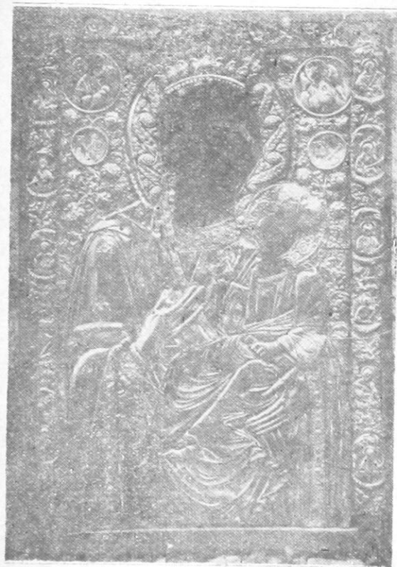
Ἡ εἰκὼν τῆς Ὑπεραγίας Θεοτόκου τῆς Σούδας.

1). Εἰκὼν Παναγίας (Τέμπλου) ἀμφιπρόσωπος (113 Χ0,68). Ἡ εἰκὼν αὕτη εἶναι τύπου Ὁδηγητρίας πολὺ ἐφθαρμένη καὶ ἀδεξιῶς ἐπεσκέυασμένη.