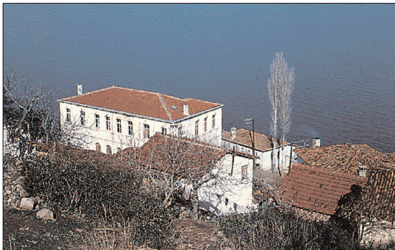
Ελλιγμοί. Το επίνειο του Παλλαδαρίου στα δυτικά παράλια του Κιανού κόλπου της Προποντίδας. Οι φιλοπρόοδοι κάτοικοί του συντηρούσαν με ετήσια δαπάνη 90 χρυσών λιρών, Δημοτική Σχολή Αρρένων και Παρθεναγωγείο στα οποία φοιτούσαν 180 μαθητές και μαθήτριες (Φωτ. 1975).

Χάρακας, Ρύσιον, Ακρίτας, Παντείχιον, Βρύας, Πελεκάνον... Και ο δρόμος, δίπλα από ερείπια πύργων βυζαντινών, κάστρων που τον διαφέντευαν παλαιά από ορδές των πολεμίων, ανάμεσα από παραπόλια Γραικορωμαίων και χωριά των Οθωμανών, ελίσσεται προς το ευλογημένο και πλουτοφόρο τρίστρατο της πάλαι ποτέ ευδαίμονος Βασιλεύουσας, σπεύδοντας ν' ανταμώσει την προνομιούχο εκείνη λωρίδα γης και θάλασσας, που στο κατάστενο σμίξιμο δύο κόσμων στέριωσε και τράνεψε δυο περιλαμπρές αυτοκρατορίες.