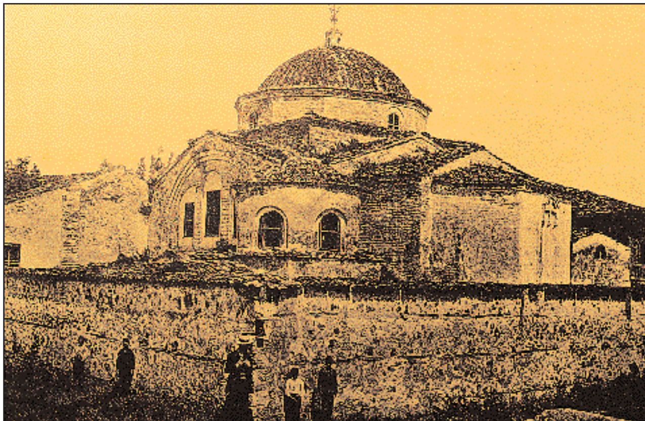
Ο ναός της κοιμήσεως στη Νίκαια της Βιθυνίας, κτίσμα των μέσων χριστιανικών χρόνων που ανατινάχθηκε μετά την έξοδο των Ελλήνων, το 1922 (φωτ. 1912).

Με δέος τα γριποκάϊκα των Αρτακινών караβοκυραίων καβάζτζαραν το άγριο μπουγάζι της Γωνιάς, κατάντικρα στα Χουχλιά της Αλώνης, καθώς τα μπουρίνια εδώ κατηφορίζουν απρόσμενα κι ορμητικά από τις αιώνια σκοτεινές κορυφές του Διδύμου και του όρους των Αρκτων. Γνώριζαν όμως καλά πως από κει ψηλά, εναποθετημένη σε προσκυνητάρι περιχρυσό, τους προστάτευε αιώνες τώρα η Παναγία η Φανερωμένη. Το πετρόκτιστο μοναστήρι της ορθωμένο δίπλα σε φαράγγι κατάφυτο, «τόπος αληθούς παραδείσου», είχε καταλάβει τον χώρο αρχαιότατου ναού αφιερωμένου από τους Αργοναύτες στη μητέρα των Θεών Κυβέλη. Στο μεγάλο πανηγύρι της Φανερωμένης έσπευδαν οι πιστοί απ' όλα τα γύρω κυζικινά χωριά· τη Γωνιά, τα Ρόδα, το Χαράκι, τη Δρακούντα, το Βαθύ,