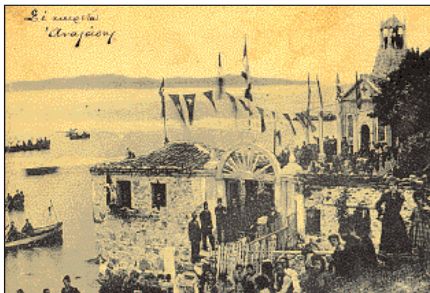
Η παραθαλάσσια μονή της Αγίας Τριάδας στην Πάνορμο κατά την ημέρα της πανηγύρεως 1906.

Δύο παρακείμενες λίμνες καθρεφτίζουν στη γαλήνη των νερών τους το μουντό όγκο του βυθυνικού όρους: η Ασκανία ανατολικά και προς δυσμάς, η Αρτυνία λίμνη γειτονεμένη με τη γη της Δαφνουσίας, μιας χώρας κατάσπαρτης από τα σχεδόν λησμονημένα σήμερα Πιστικοχώρια: Το Πριμικήρι, το Σιργιάνι, οι Απελλαδάτοι, οι Καμαριωτάτοι, οι Αγινάτοι, οι Κωνσταντινάτοι, το Αναχώρι, ο Γουλιός και τόσα άλλα, που είχαν εποίκιστεί από εξόριστες οικογένειες της Πελοποννήσου. Η Απολλωνία, καστροπολιτεία ειδυλλιακή, κτισμένη σε βραχώδη παραλίμνια νησίδα της Αρτυνίας, άκμασε κατά την Αλεξανδρινή, αλλά και στη μετέπειτα Ρωμαϊκή και Βυζαντινή εποχή, για να αποτελέσει στα πρόσφατα χρόνια της Τουρκοκρατίας φάρο πνευματικό όλης της γύρω Δαφνουσίας χώρας. Στα παράλια στις δυτικές ακτές του Κιανού κόλπου, άκμασαν μέχρι την έξοδο δύο ακόμα επαρχίες της Μητροπόλεως Προύσης: η Τρίγλεια και η Σιγή, πολιτείες πλαισιωμένες από τη θάλασσα των ελαιόδενδρων που κατηφορίζουν αιωνόβια από