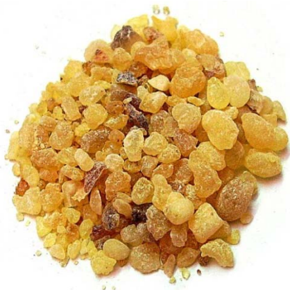
Λιβάνι / Olibanum