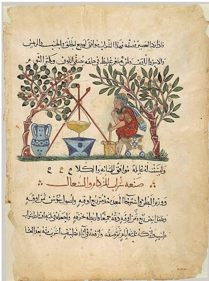
Μία σελίδα από αραβική μετάφραση του 1224 της Φαρμακολογίας του Διοσκουρίδη ( Περί ύλης ιατρικής ή De Materia Medica ).

Στη σημιτική οικογένεια δεν ανήκουν: οι Σουμέριοι, οι Χετταίοι, οι αρχαίοι Αιγύπτιοι, τα ιρανικά έθνη, οι Αρμένιοι, καθώς και οι Κούρδοι, που κατείχαν τις παρυφές του σημιτικού κόσμου: τα βόρεια της οροσειράς του Ζάγρου, η οποία χωρίζει τη Μεσοποταμία από το Ιρανικό Οροπέδιο. Φυσικά, δεν ανήκουν και οι Έλληνες, που κυριάρχησαν πολιτικά και σε μεγάλο βαθμό πολιτιστικά στον χώρο επί μία χιλιετία (333 π.Χ. – 636 μ.Χ.) και επέδρασαν ουσιαστικά στη διαμόρφωση του μεσαιωνικού και νεότερου χαρακτήρα της Ανατολής. Δεν ανήκαν ούτε οι Ρωμαίοι-κληρονόμοι των ελληνιστικών βασιλείων, ούτε οι Φράγκοι (σταυροφορικά κρατίδια), αλλά ούτε και τα τουρκικά έθνη που ήρθαν κατά κύματα μεταξύ 1000 και 1300, ώσπου εντέλει να αποτελέσει όλη η Μέση Ανατολή ως τον Ζάγρο τμήμα της Οθωμανικής Αυτοκρατορίας.