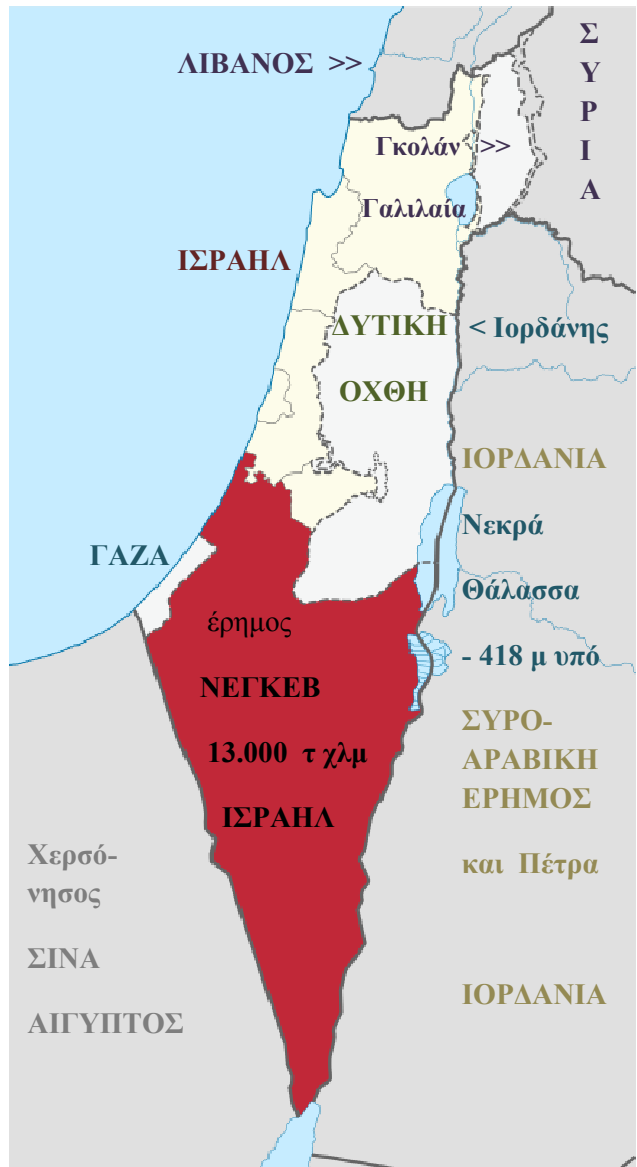
Ο ανατολικός μυχός της Ερυθράς Θάλασσας, ανάμεσα στην Αραβική Χερσόνησο και τη Χερσόνησο του Σινά, όπου βρίσκονται δίπλα-δίπλα τα λιμάνια της Α = Άκαμπα (Ιορδανία) και του Ε= Εϊλάτ (Ισραήλ), τα μοναδικά επίπεδα των δύο κρατών στην Ερυθρά. Το Βαθύπεδο ή Σχίσμα της Μέσης Ανατολής κατεβαίνει από την Κοιλάδα της Μπεκάα (Λίβανος) στον π. Ιορδάνη, τη λίμνη Τιβεριάδα / Γαλιλαία (που βρίσκεται 213 μ υπό την επιφ. της θάλασσας) συνεχίζει πάλι στον Ιορδάνη, στη Νεκρά Θάλασσα (το χαμηλότερο σημείο του φλοιού της γης: - 418 μ). Συνεχίζει στο Ουάντι αλ-Αραμπάχ, ένα φαράγγι μήκους 170 χλμ που καταλήγει στην Ερυθρά.