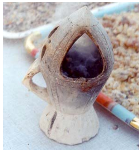
Θυμιατό της Σομαλίας