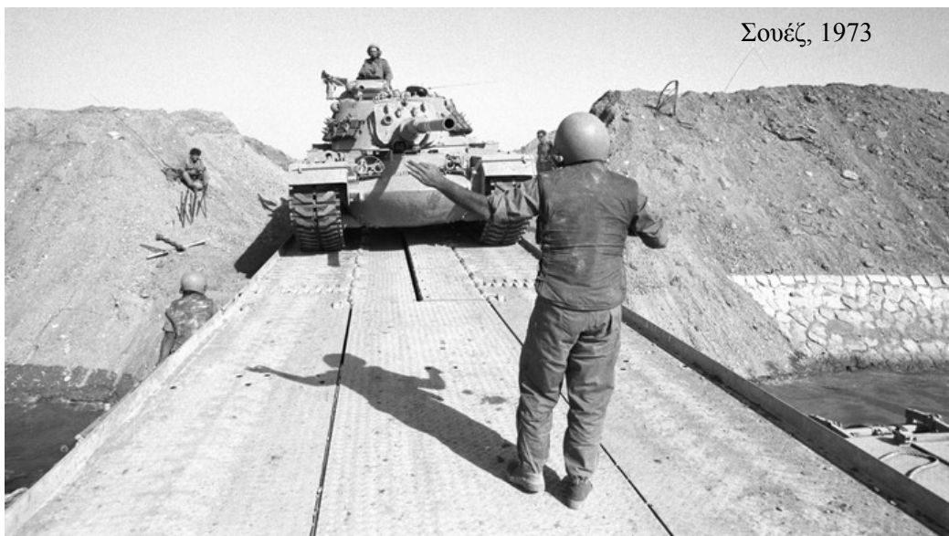
Ακόμα και τον δρόμο για τον Νείλο ξαναπήραν, περνώντας το Κανάλι του Σουέζ. «Σε παρομοιάζω, αγαπημένη μου, με ωραία φοραδοπούλα ζεμένη στ' άρματα του Φαραώ» Άσμα Α9