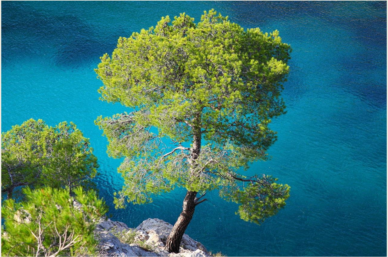
Πεύκη η Χαλεπινή, ΒΔ Συρία – σύνορα με την Τουρκία

Στην Αρουάντ (αρχαία Αντάραδο), κοντά στα σύνορα Συρίας – Λιβάνου: μικρός ταρσανάς