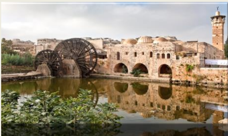
Χάμα (στην Κοίλη Συρία)