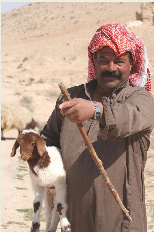
Στην έρημο της Συρίας