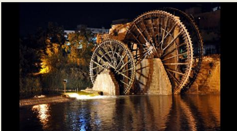
Υδροτροχοί στον Ορόντη