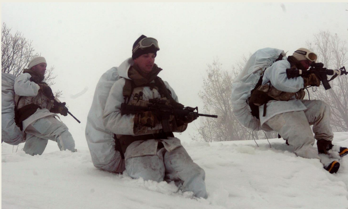
Ισραηλινοί καταδρομείς στο κατεχόμενο τμήμα όρος Έρμων / Ερμών

Ερμών. Στα νότια του Αντιλιβάνου, ανάμεσα στη Δαμασκό και την κοιλάδα του Ιορδάνη, ορθώνεται ο Ερμών (2.814 μ). Το πανέμορφο χιονοσκεπές βουνό κλείνει βόρεια, δυτικά και νοτιοδυτικά τη Δαμασκό και καταλήγει στα κατεχόμενα Υψίπεδα του Γκολάν (κορυφή στα 1.226 μ).