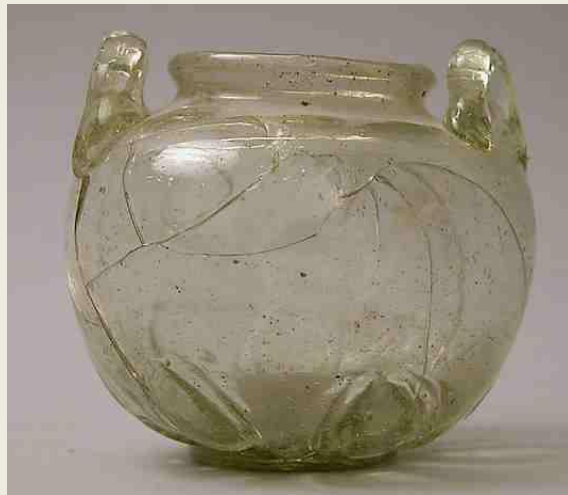
Κάτω: Δοχείο από πρεσαρισμένο γυαλί. Πρώιμη Ισλαμική εποχή, 9ος-10ος αιώνας. Μητροπολιτικό Μουσείο, Νέα Υόρκη