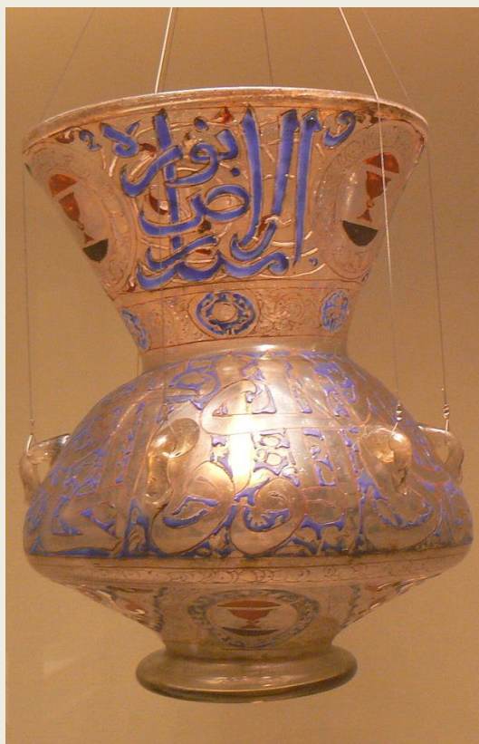
Γυάλινη καράφα, 12ος αιώνας, και γυάλινη καντήλα με σμαλτωμένη επιγραφή και διακοσμήσεις από τη μεσαιωνική Περσία (Ιράν). Μουσείο του Λούβρου, Παρίσι