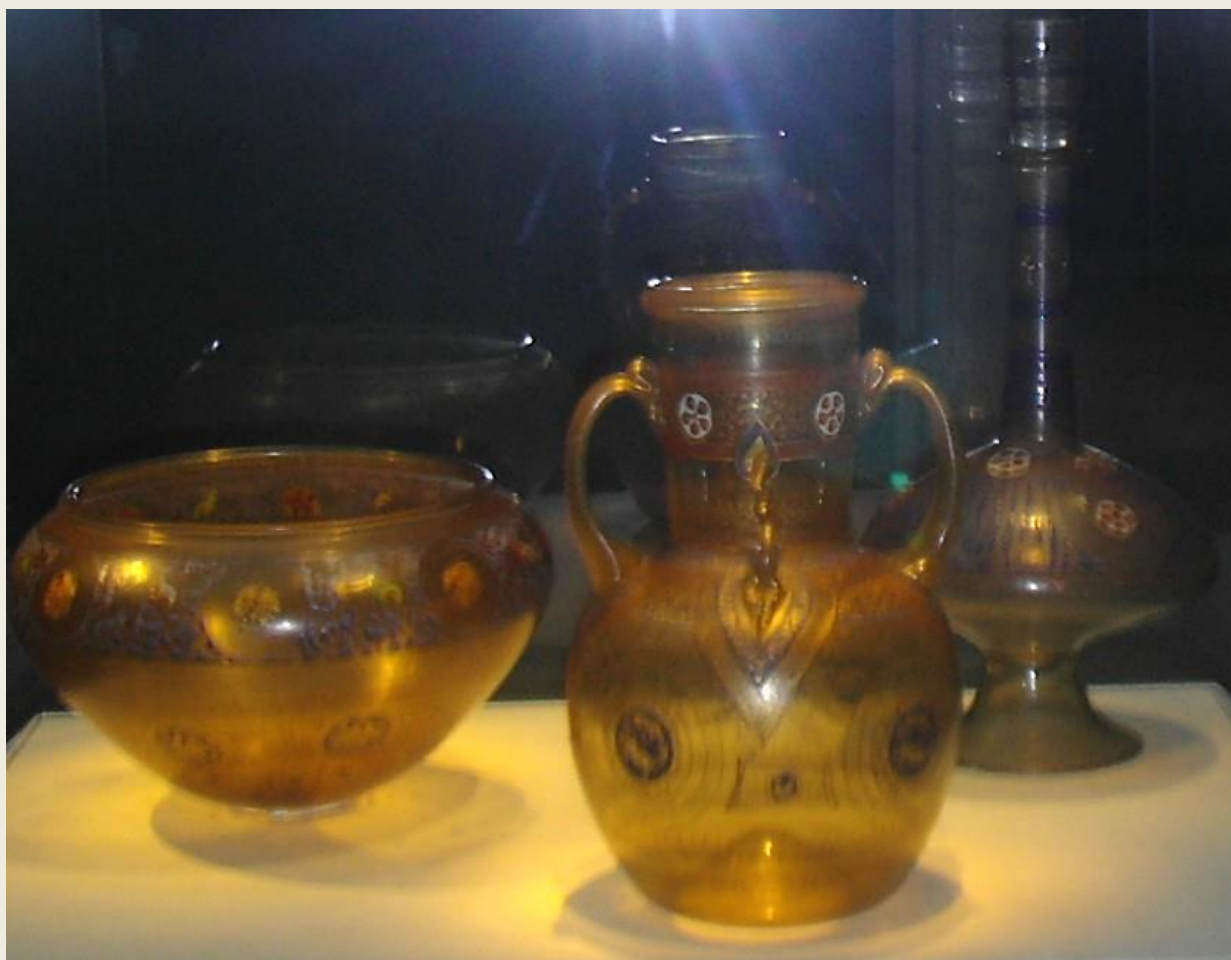
«Ο θησαυρός της Υεμένης». Τρία αντικείμενα από φυσικό γυαλί κατασκευασμένα στη Συρία την εποχή των Μαμελούκων, για να πάνε στον σουλτάνο της Υεμένης, αλλά κατέληξαν στην Κίνα. Χρονολογούνται μεταξύ 1325 και 1340. Γκαλερί Free and Sackler, Ουάσιγκτον