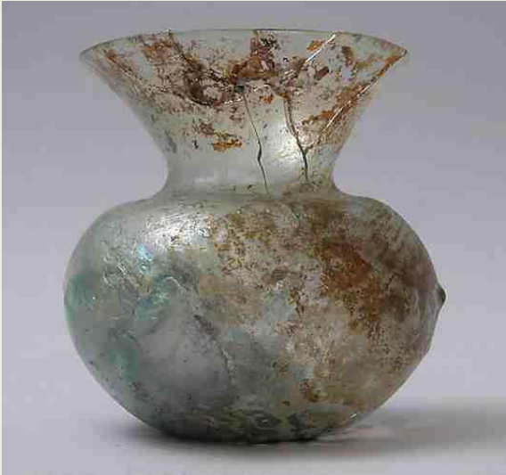
Αριστερά: Μικρό αγγείο από φουσητό γυαλί και μεταλλικά ψήγματα που το κάνουν να λαμπυρίζει. Πρωτοβυζαντινή εποχή, 4ος-5ος αιώνας. Μητροπολιτικό Μουσείο, Νέα Υόρκη