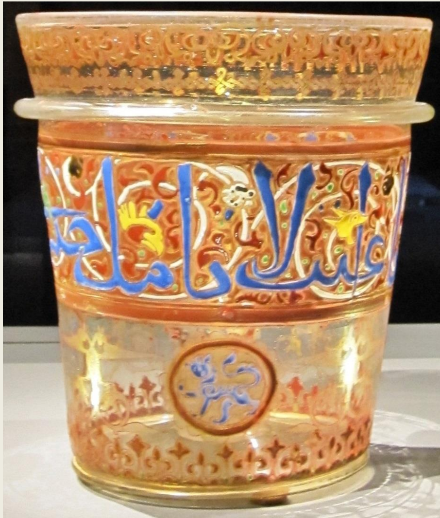
Στο Εθνικό Μουσείο της Δαμασκού