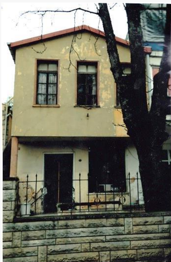
Το Σχολείο της Πρώτης