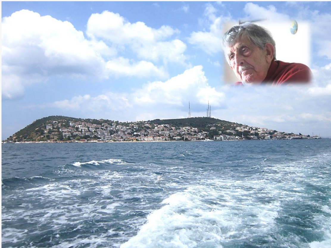
Η Πρώτη, το πιο κοντινό στην Πόλη νησί του συμπλέγματος των Πριγκιπωνήσων