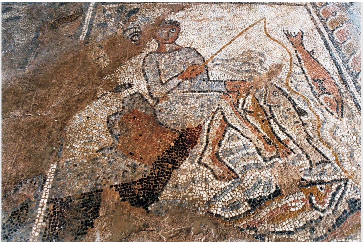
Οι ανθρώπινες μορφές (ψαράδες ή κυνηγοί) εμφανίζονται περιορισμένες κυρίως στα γεωμετρικά διάχωρα σε βασιλικές (Αγία Παρασκευή και Καισάρεια Κοζάνης, Αμφίπολη, Μαρώνεια).

Ο βορειοελλαδικός χώρος επιφύλασσε πολλές και εξαιρετικές ψηφιδωτές συνθέσεις. Προέρχονται τόσο από εκκλησιαστικά συγκροτήματα όσο και από κοσμικά οικοδομήματα (Θεσσαλονίκη, Βέροια, Φιλίππους, Αμφίπολη, Δίον, Χαλκιδική, δυτική Μακεδονία και Θράκη (Μαρώνεια). Το κύριο σώμα του πρόσφατου τόμου περιλαμβάνει ψηφιδωτά από τις αρχές του 4ου ως τα τέλη του 6ου αιώνα μ.Χ.