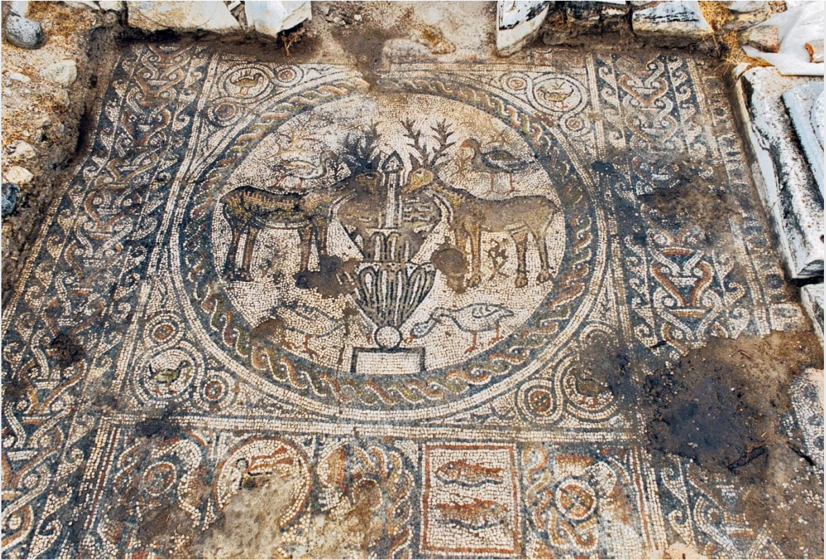
Το ελάφι, σύμβολο του χριστιανισμού στα ψηφιδωτά δάπεδα, εικονογραφεί συνήθως το κείμενο του Ψαλμού 41.1.